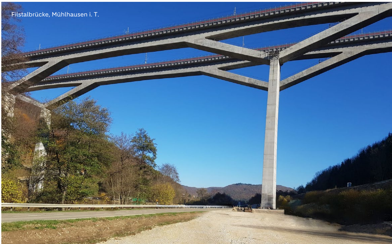
Filstalbrücke, Mühlhausen i. T.